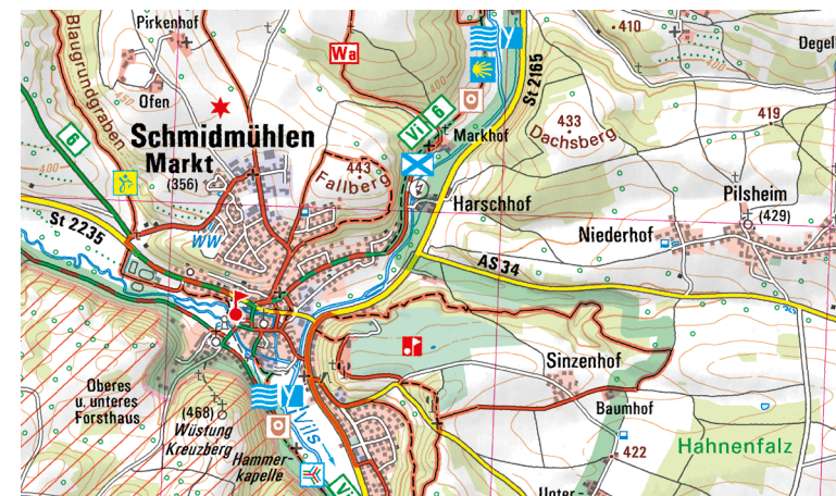
Ausschnitt aus UK50-19 Naturpark Hirschwald

Erholung und Spaß für die ganze Familie bieten die beiden Wohlfühlbäder Bulmare in Burglengenfeld und das Kurfürstenbad in Amberg. Schöne Ausflugsziele für Jedermann sind der Freizeitpark Monte Kaolino bei Hirschau, das Freilandmuseum Goglhof in Eberhardsbühl bei Edelsfeld oder das Planetarium in Ursensollen.